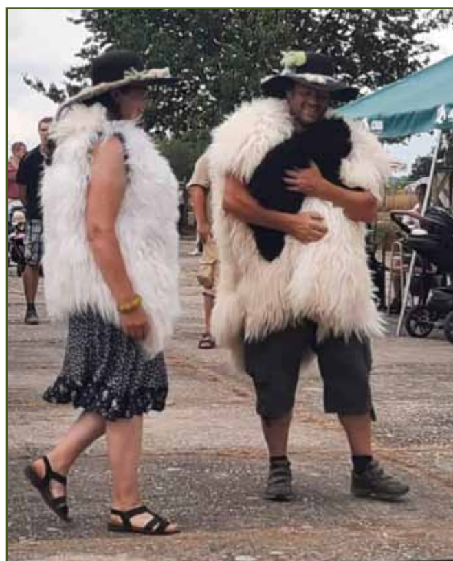
Modely 'Když bača sejde z hor' - kožichy z valašské ovce a k tomu štěně plemene puli (nejmladší z ovčáckých psů, který také předvedl ukázkou pasení ovcí)