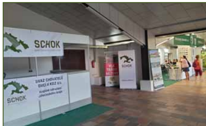
Stánek Jihočeského krajského sdružení SCHOK