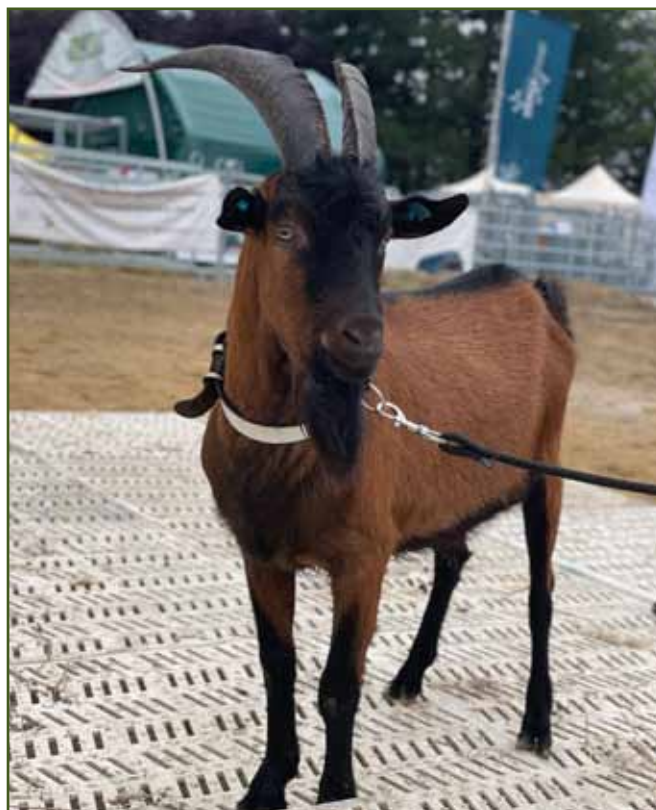
Hnědý krátkosrstý kozel chovatelky Milady Macháčkové

Následovala ukázka dojení koz včetně zapojení diváků, kteří si chtěli ruční dojení vyzkoušet. Nesmělo chybět