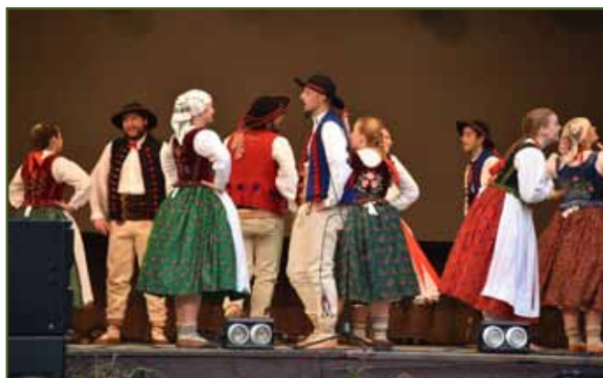
Na scéně se střídají taneční soubory od nejmenších po dospělé účastníky