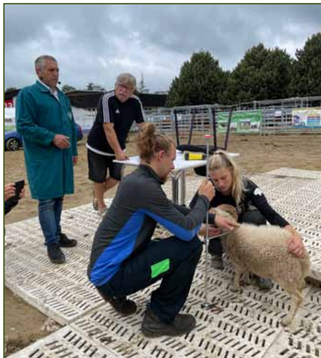
Přeměřování kohoutkové výšky ouessantského beránka