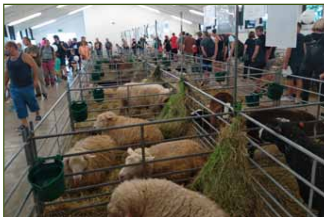
Celkový pohled na výstavu ovcí a koz

Ve dnech 28. 8. 2022 až 30. 8. 2022 se konala tradičně největší agro výstava v ČR Země živitelka v Českých Budějovicích. Po zrušeném TechAgru v Brně bylo od letošního ročníku hodně očekáváno. Pořadatelé Výstaviště ČB se podařilo zaplnit výstavní plochu na 100 % a doprovodný program sestavit zajímavý jak pro vystavovatele, odbornou veřejnost, tak i pro všechny návštěvníky. Bylo k vidění velké množství moderní zemědělské a potravinářské techniky, zajímavá byla expozice Národního zemědělského muzea, ale na své si přišli i zájemci o myslivost či včelařství nebo rybářství. Velký prostor pro svou prezentaci dostali zástupci masných plemen skotu.