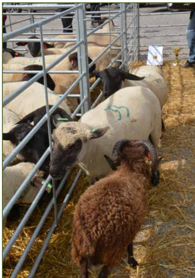
Finále šampion beran