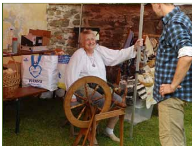
Ukázky zpracování ovčí vlny