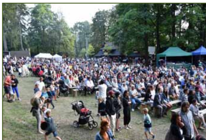
O návštěvníky nebylo v Městském lese nouze