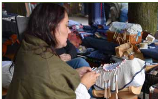
Na Gorolu nemohla chybět ani lidová řemesla