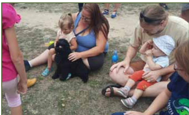
Nejmladší z ovčáckých psů... Chvilí pásá ovečky, ale pak se rozhodla, že diváci jsou zajímavější