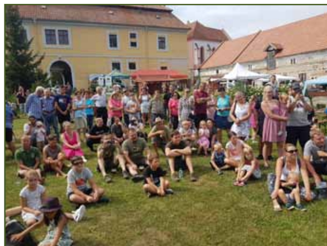
Pozorné publikum stříhačského klání