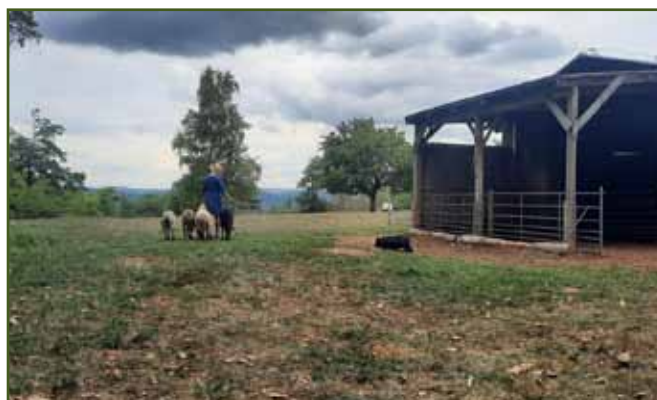
Psiska připravena na ovečky... Tak už ty ovce pust'