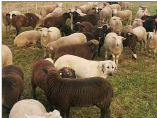
Odrostlé štěně s odrostlými jehnaty volně na pastvě. Pokud budou jehnice, které si takto na psa zvyknou, zařazeny do chovu, přijmou v budoucnu i další pastevecké psy snáze.