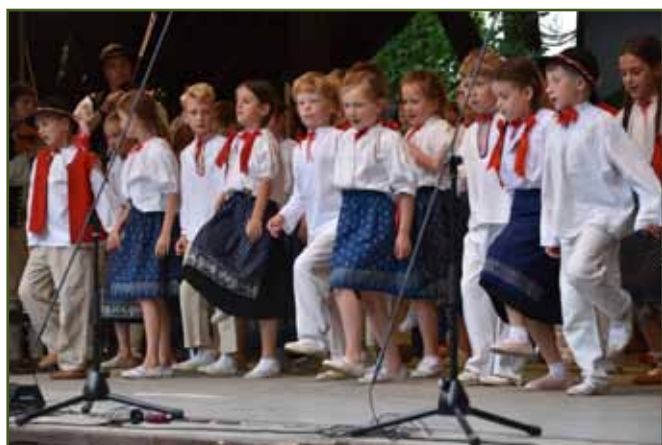
Scéna patří malým tanečníkům