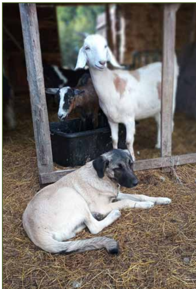
Štěně kangala, které bylo zařazeno ke zvířatům zvyklým na pastevecké psy. Kromě počáteční lehké nedůvěřivosti už zvířata dalšího psa tolik neřeší.