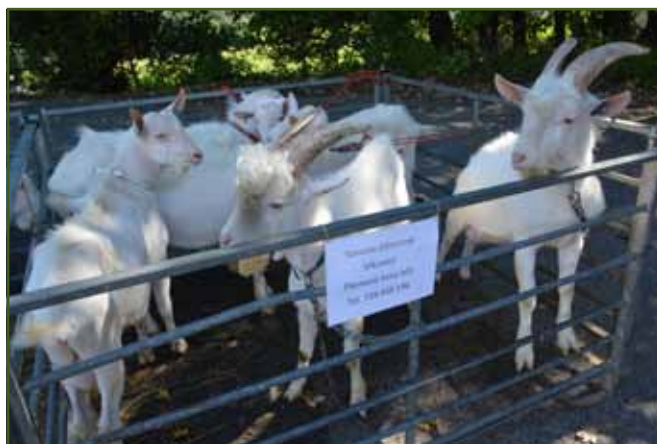
Bílí kozlíci Simony Silberové