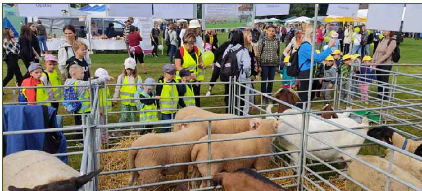
Školkáčci měli z ovcí a koz upřímnou radost.