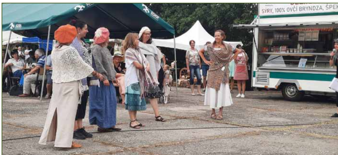
Modely z vlněné módní přehlídky, autor Jana Suchá