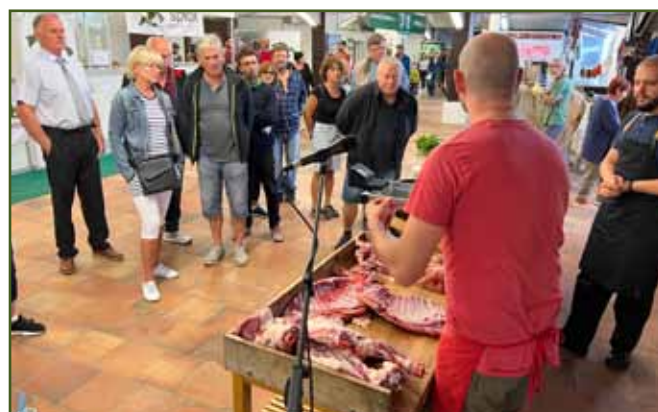
Ukázka rozporcování jehněčího trupu