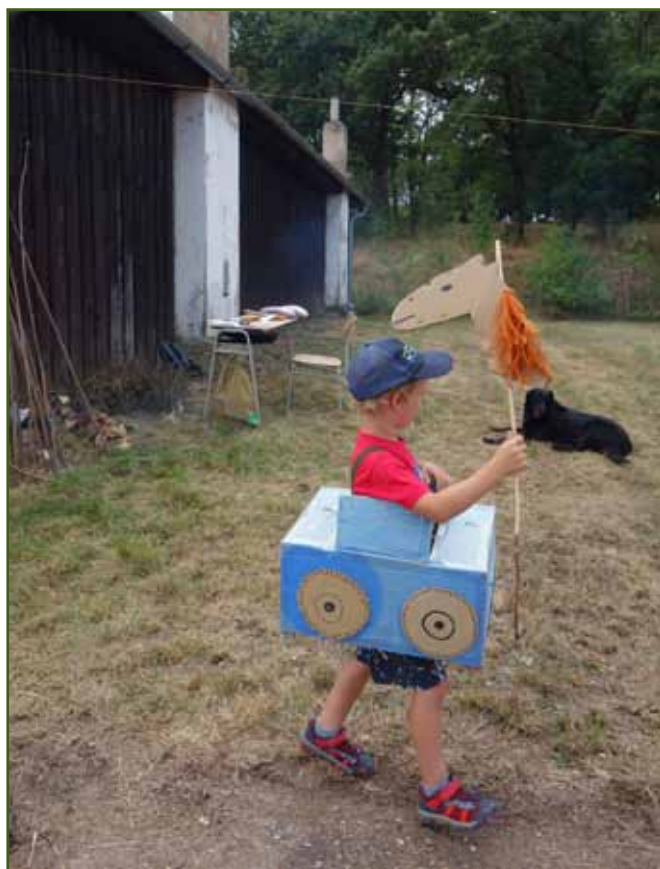
Nadějný forman vyjíždí...