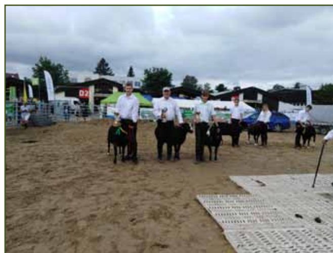
Všichni zúčastnění berani šampionátu beranů ZW, vítězové v popředí