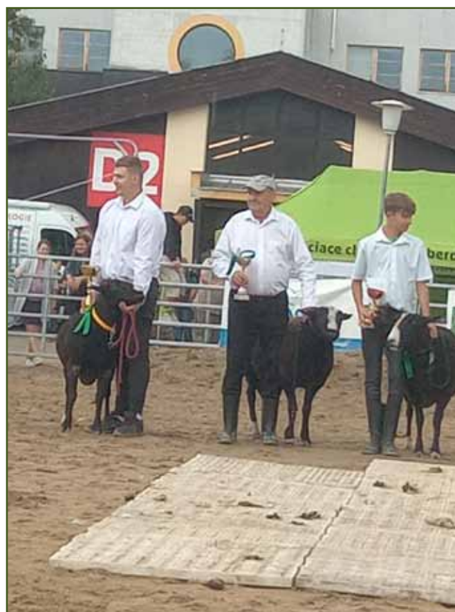
Vítězové šampionátu beranů zwartbles 2022

Jakmile se komise doradila, přistoupili jsme k vyhlá-