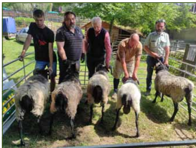
Výběr šampionů ENT beranů šedé ovce vřesové

Jako hlavní úkol pro jednání na RPKO stanovili prosazení úpravy šlechtitelského programu ovce vřesové, která se týká zjednodušení hmotnostních limitů pro připuštění beranů na trh. Základním limitem pro předvedení beranů na první jarní trhy by měla být, ve věku berana 12 měsíců, hmotnost 50 kg. Při hodnocení budou hodnotitelé přihlížet ke stáří berana v době jeho bonitace a váhu k jeho věku úměrně dopočítají s tím, že beran má, dle standardu ovce vřesové, dosáhnout ve stáří 18 měsíců minimální hmotnosti 65 kg. Z diskuse k tomuto bodu vyplynulo, že při hodnocení berana je nutné brát ohled na jeho životní podmínky - např. pozdější nástup pastevní sezóny v horských oblastech a tím způsobený pomalejší váhový přírůstek oproti beranům z chovů s intenzivnějším výkrmem a bohatou pastvou. Diskuse se zúčastnili i nově přijatí členové klubu, Michal a Jitka Berkovi.