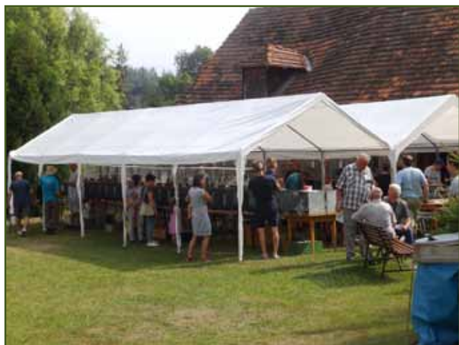
V části areálu bylo vystaveno ve spolupráci s kasejovickými chovateli i drobné zvířectvo