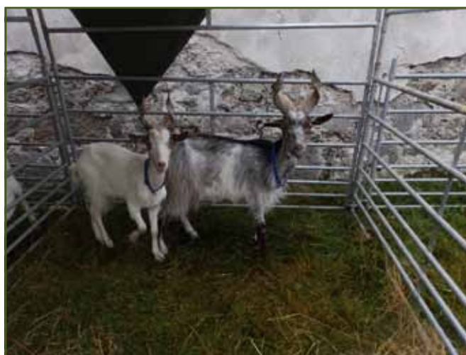
Raritou na výstavě bylo plemeno koz girgentánských