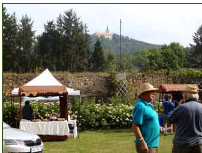
Akce se konala v historickém prostředí farní zahrady s výhledem na zámek Zelená Hora