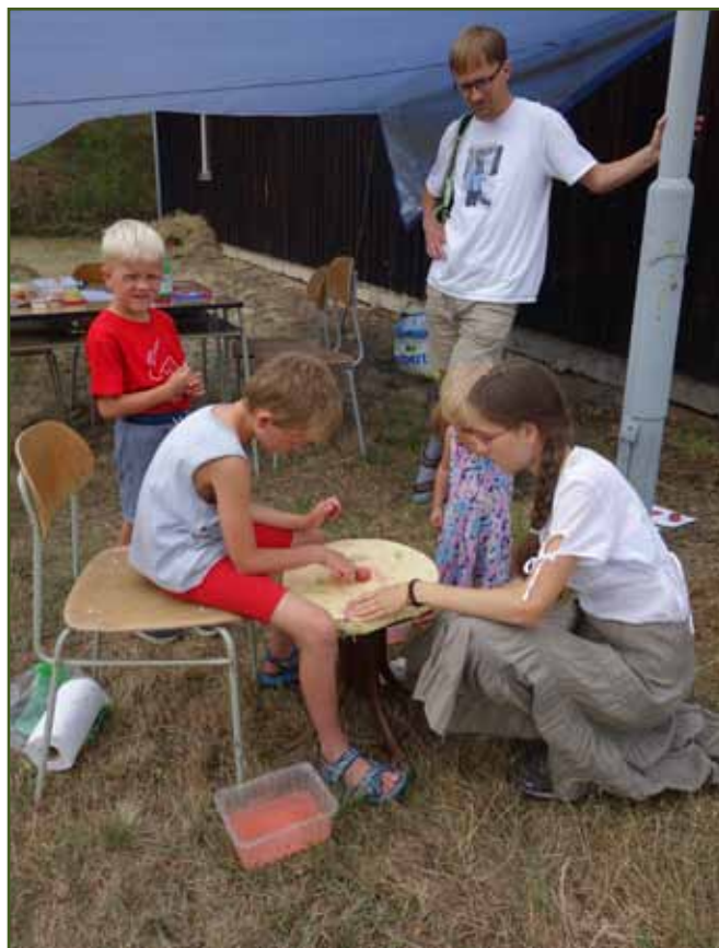
Hrnčířská dílna se skorohrnčířským kruhem