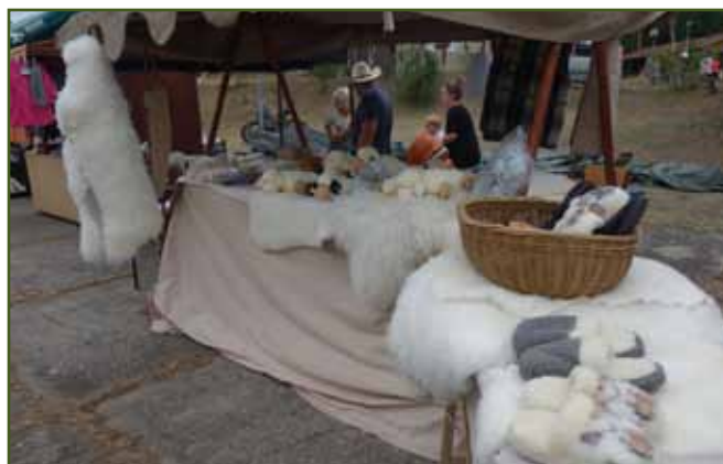
Vlněný stánek od Vítků