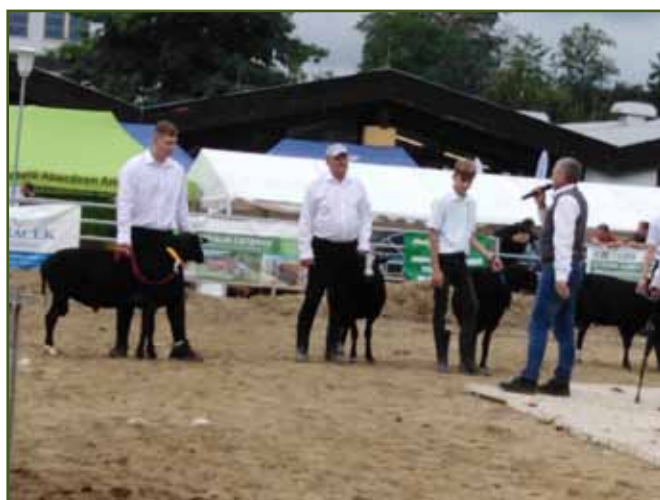
Berani jsou seskládáni podle pořadí, komise vysvětluje své rozhodnutí