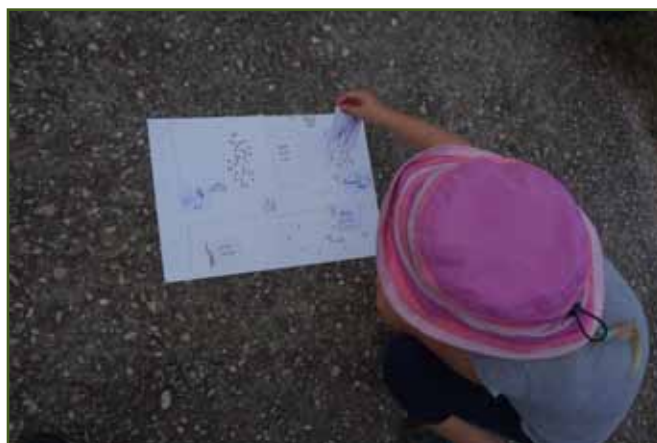
Plánek Jičína a okolí - součást formanských zkoušek

Na tradičním místě mezi sruby přivítal děti letos forman Šejtroček. Na jičínské náměstí se dostaly „věžovou branou“, některé nám nastavily i správný čas na papírových hodinách. Zde dostaly první úkol: složit formanské zkoušky. Za pomoci rodičů se zorientovaly na plánu a s koněm a vozem se vydaly do čtyř měst zjistit, co že to tam Šejtroček vezl. Za splnění úkol vyfasovaly „Formanskou knížku“, se kterou vyrazily na další stanoviště. Na prvním si poslechly pohádku o tom, jak Šejtroček vozil hudební nástroje (a jak to dopadlo s loupežníky). Samy též jednoduché nástroje vyrobily: klapačku z mušlí, Pannovu flétnu ze slámek či hrachové chraštítko.