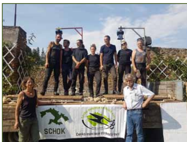
Účastníci Speed shear Nepomuk 2022