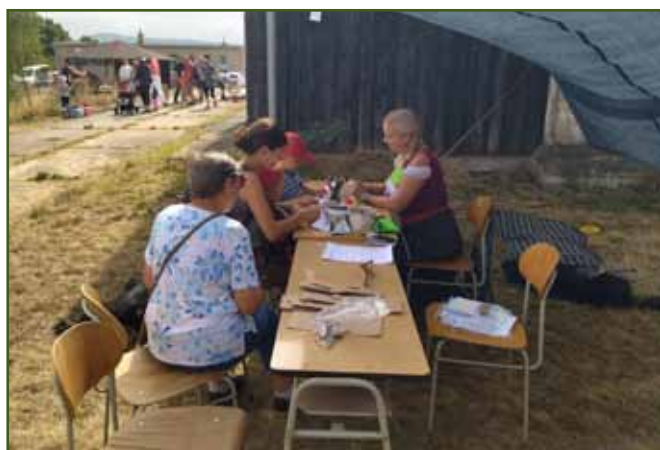
Stanoviště s hudebními nástroji