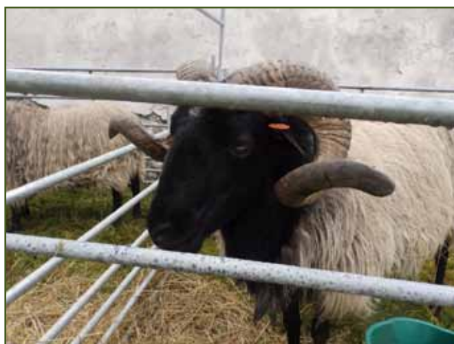
Beran ovce vřesové