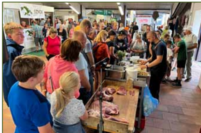
Kuchařská show - porcování masa a vaření šesti druhů jídel