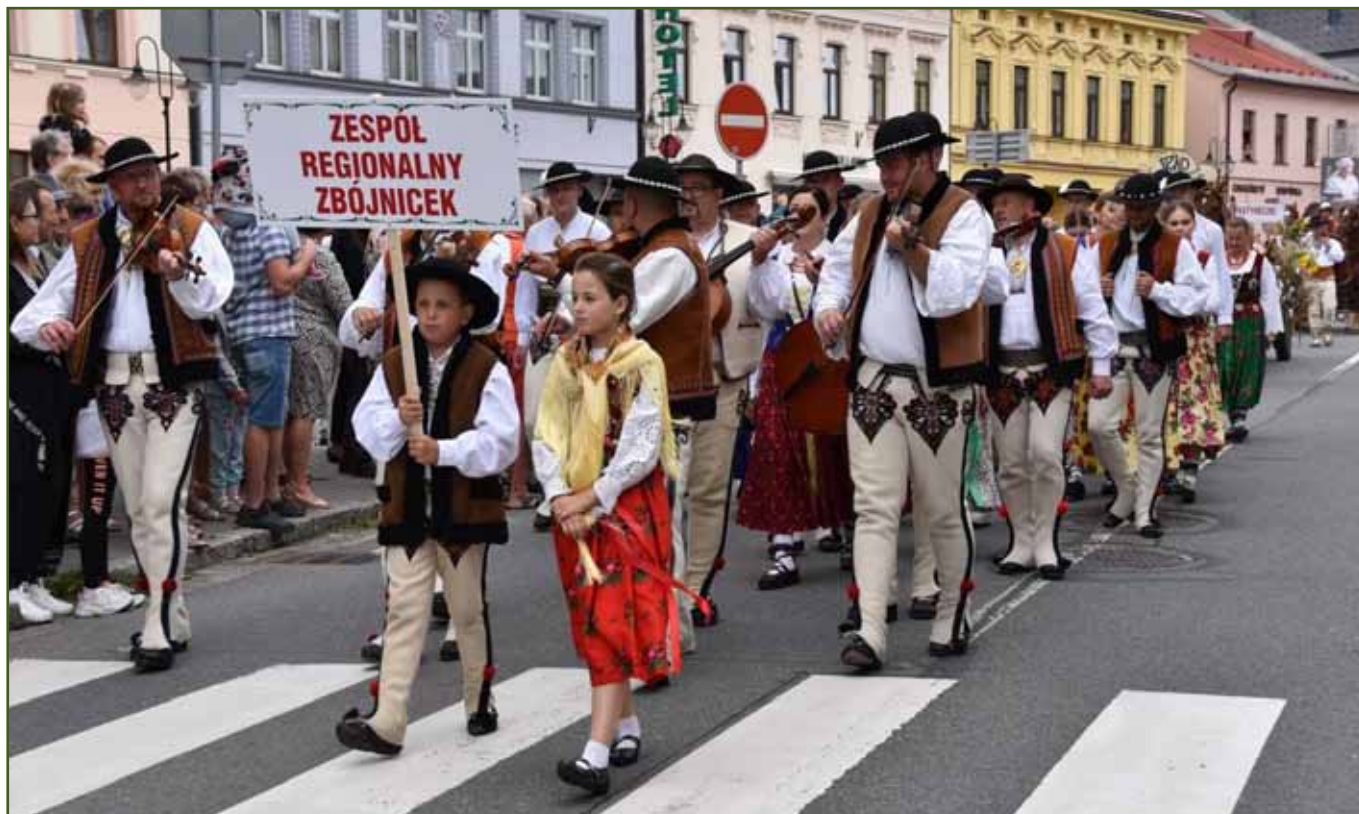
Nedělní pochod - spolky