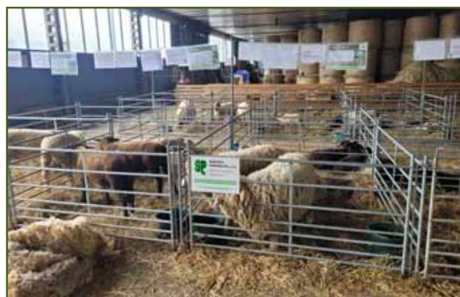
Výstava ovcí a koz