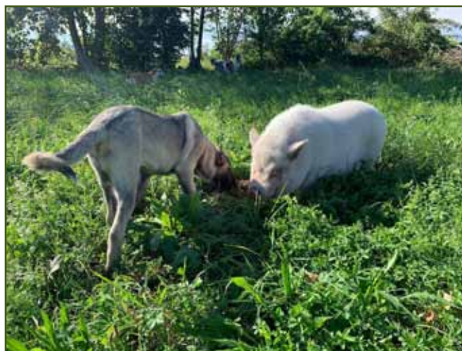
Štěně kangala se seznamuje s obyvateli farmy.

vývoj zásadní kontakt se sourozenci a jinými psy. Brzkým odběrem lze štěně více navázat na jiný živočišný druh (jak se to dříve dělalo například s kříženci psa a vlka, československými vlčáky apod.). To však u pastevců, kteří jsou z podstaty bytostně smečkoví, nepovažují za žádoucí, navíc zákon nepovoluje odběr štěňete od matky před 50. dnem věku. Ani ty nejlepší podmínky odchovu ovšem nejsou zárukou psa se skvělými vlohami pro práci. Každého psa je také třeba vychovávat, zejména první 2 roky jeho života. Každé hospodářství má trochu odlišné podmínky a pes se s nimi musí sžít, mladí psi jsou hravější a z bujnosti mohou dělat chyby.