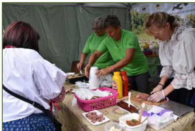
Ochutnávka skopových výrobků na stánku Moravskoslezského sdružení SCHOK z.s.