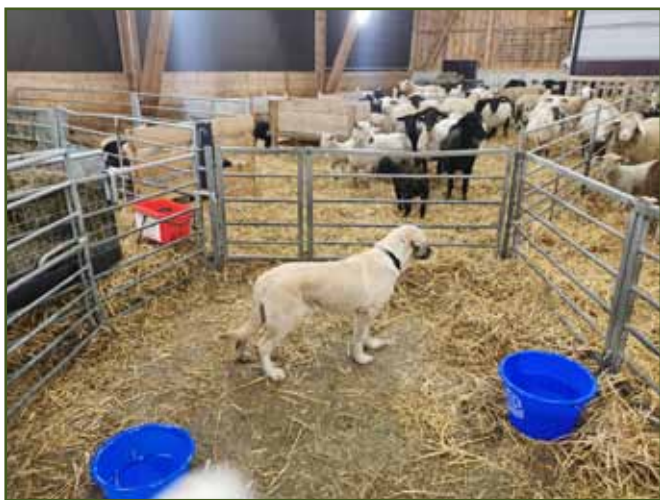
Jedno z možných řešení, jak navykat ovce na přítomnost pasteveckého psa. Pod dohledem může pes chodit k ovčím, majitel má tak kontrolu nad chováním psa i ovčí.

vídat na otázky a pomůže vám s výběrem vhodného štěněte. Ideálně bude také schopný vám říci něco o rodičích, nebo na co si dát v začátku pozor. Jak krmit, aby štěně nerostlo příliš rychle, netloustlo a netrpěl jeho pohybový aparát.