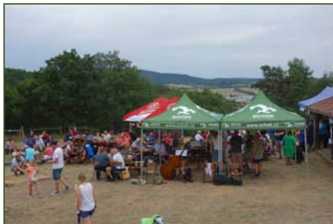
Navzdory nepříznivé předpovědi počasí máme plno