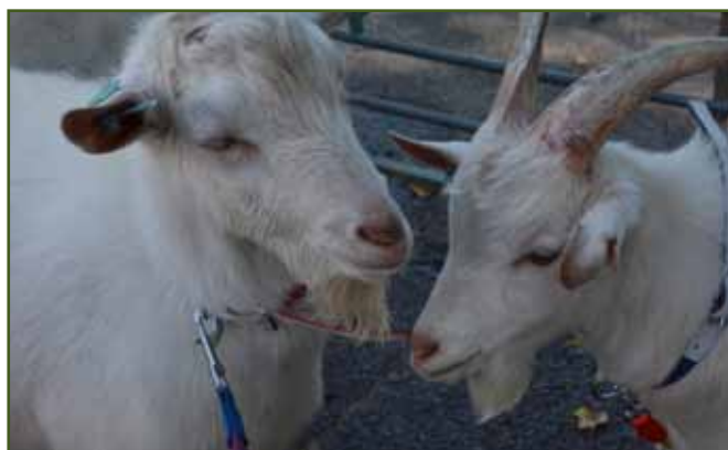
Bílí kozlíci Anny Poštůlkové