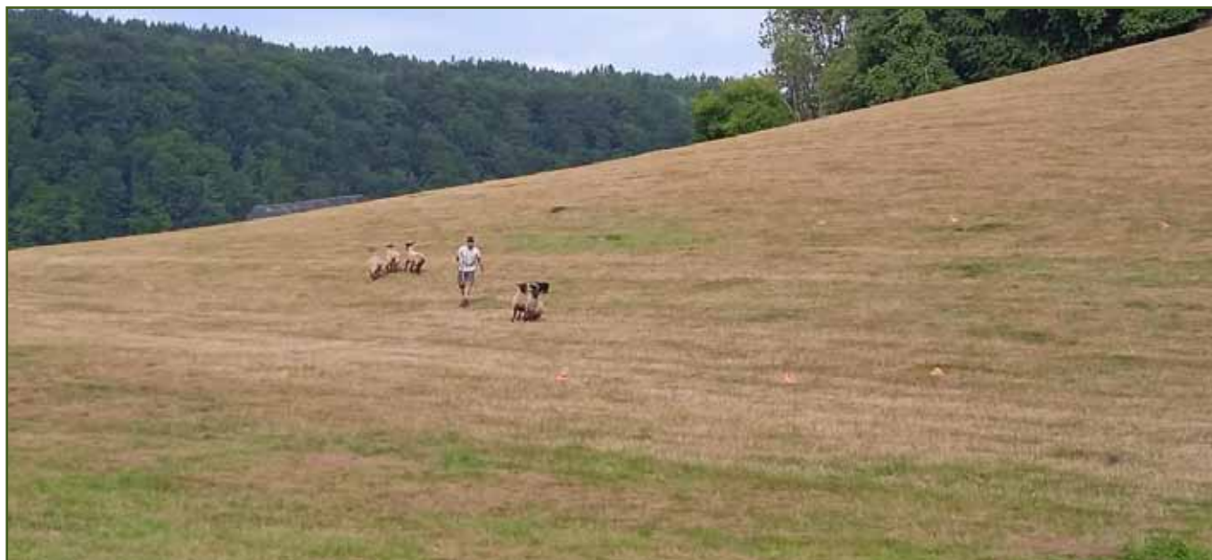
Vladimír Novák při rozdělení ovcí