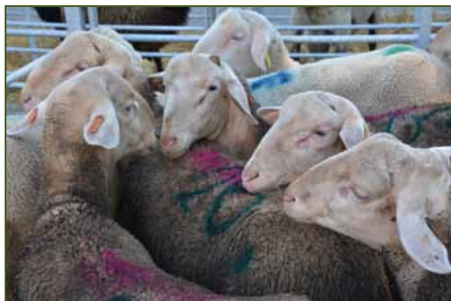
Berani lacaune Jiřího Prokeše