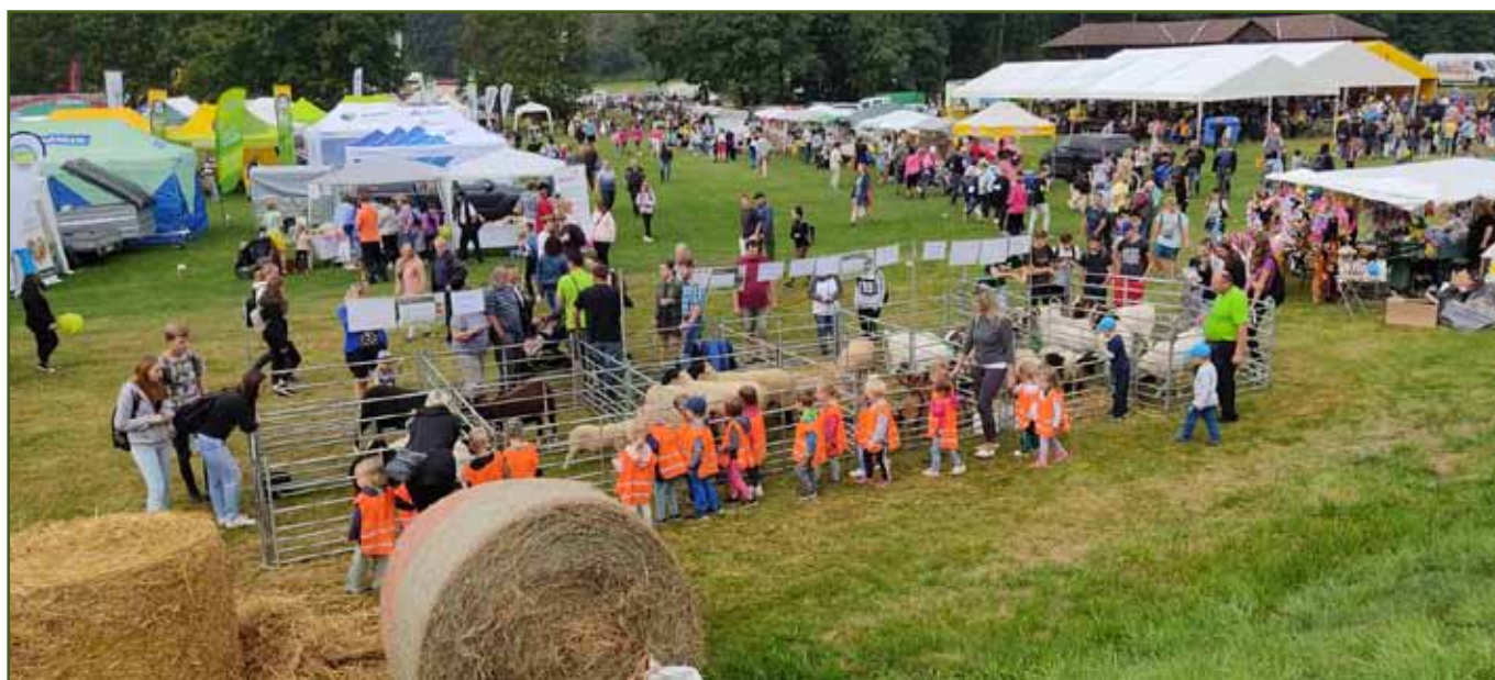
Celkový pohled na expozici ovcí a koz, stále v obležení hlavně malých návštěvníků.

Již během skládání zvířat z dopravních prostředků jsme byli v obležení dychtivých návštěvníků. Během celého dne se u kotců skoro nedalo pohnout. S vysta-