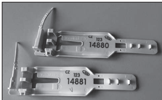
Spěnkové známky (G, H)