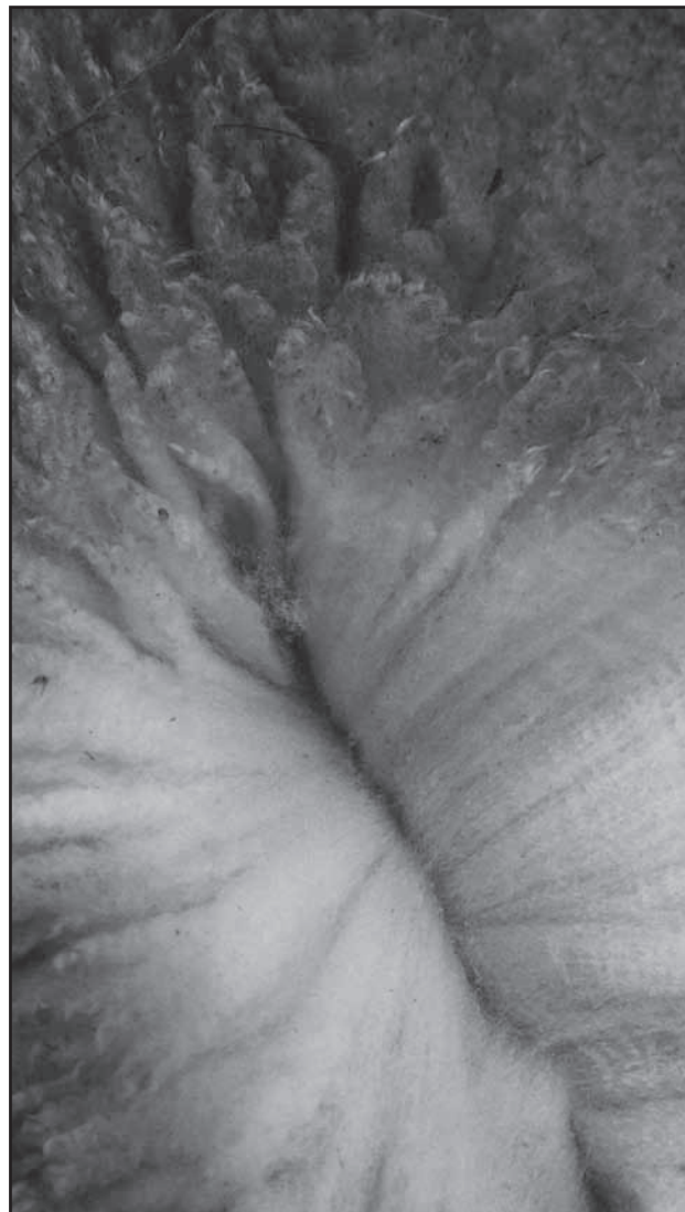
2. čistá vlna – může být zaprášená, ale není v ní sláma, větvičky, bobky a hmyz