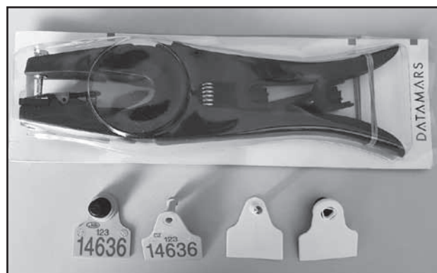
Nové ušní známky (M) s kleštěmi