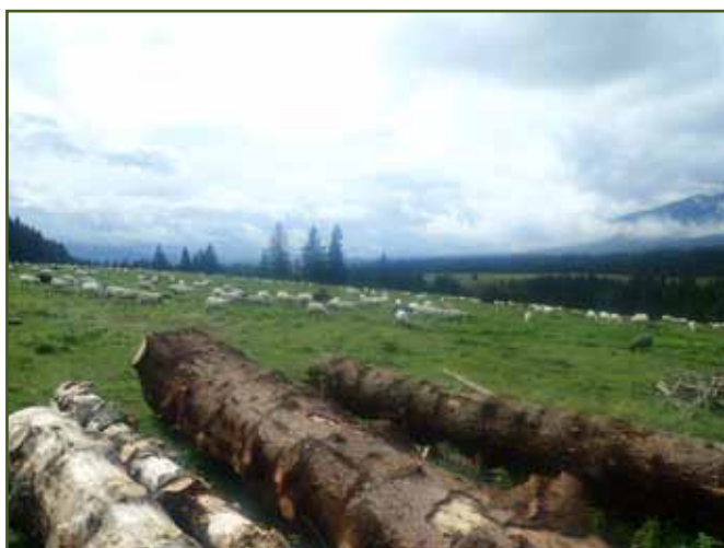
Krajina s pasoucím se stádem má magické kouzlo