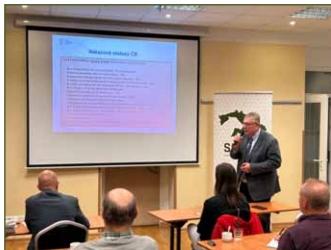
MVDr. Zbyněk Semerád, ústřední ředitel Státní veterinární správy