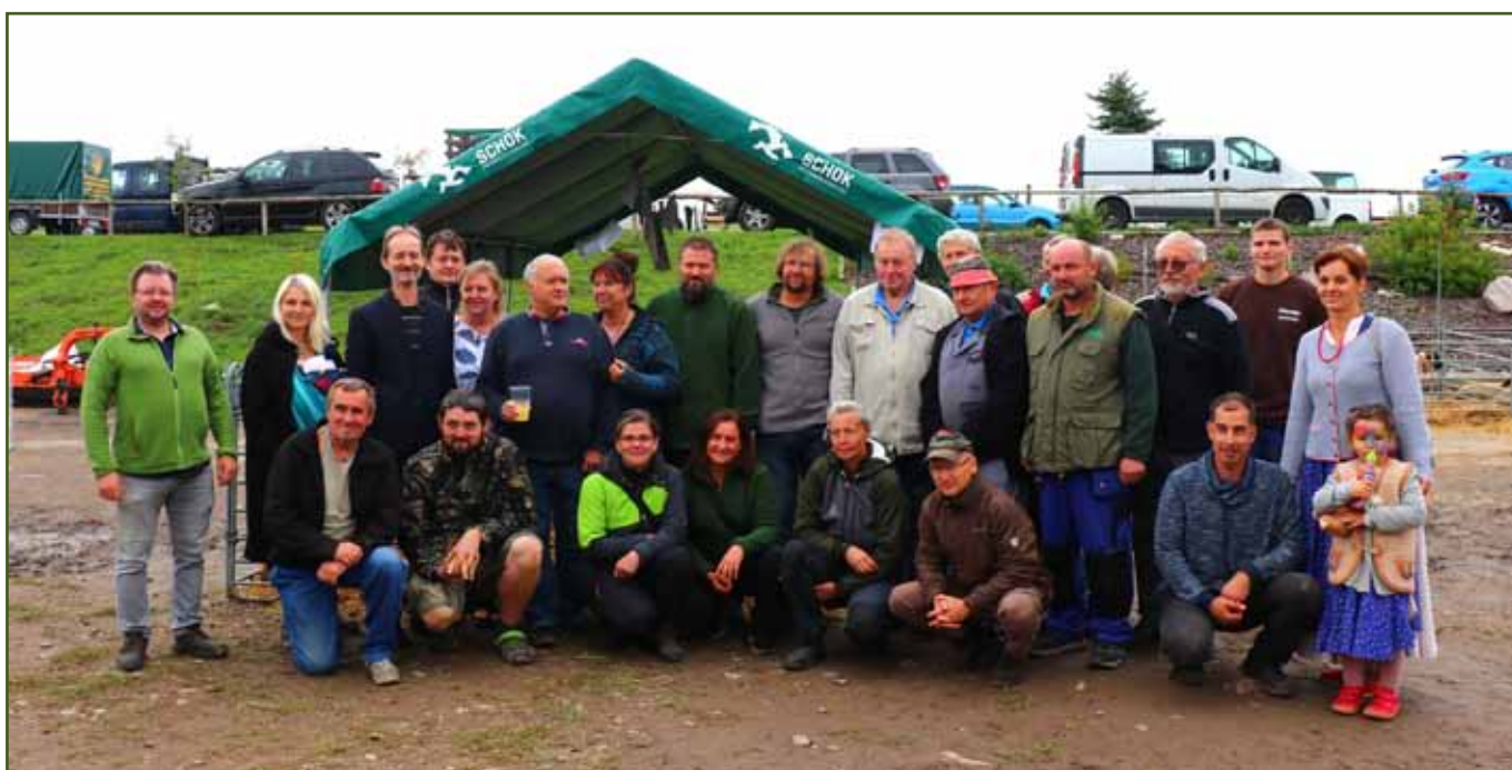
Účastníci krajské výstavy a nákupního trhu