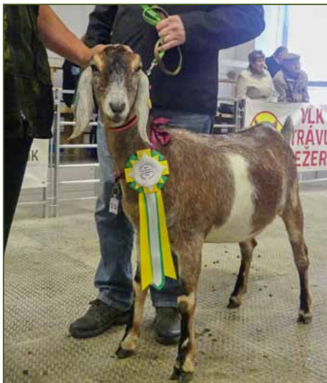
res. Šampion třídy 3A - Mladí, Viola z Modletic z chovu Ivany Pokorné

Ke každému ročníku je vydáván katalog, kde je možné najít u vystavovaných zvířat jejich původ po liniích. Podle jmen je patrné, ze kterých chovů pochází. Dále výsledky z užitkovosti a z hodnocení exteriéru. Seznam vystavovatelů a sponzorů. A také pravidla, kterými se výstava řídí.