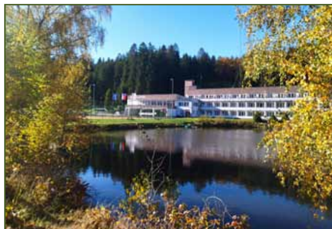
Místo konání chovatelské konference - hotel Luna, Kouty