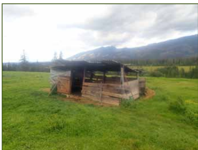
Prázdný presečí chlívček byl letos využit pro ovce, které z různých důvodů bylo třeba od hlavního stáda oddělit