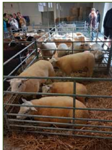
Pohled na kolekce beranů