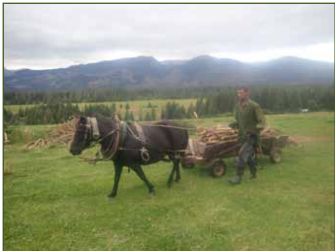
Koník Jutsa na salaši sloužil mimo jiné k dovozu haluziny pro potřeby salaše