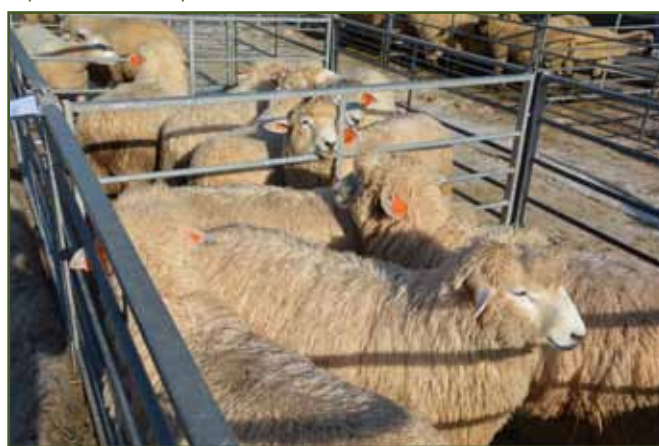
Romney z Farmy pod Radhoštěm