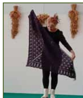
Módní přehlídka v podání Klubu zpracovatelů vlny