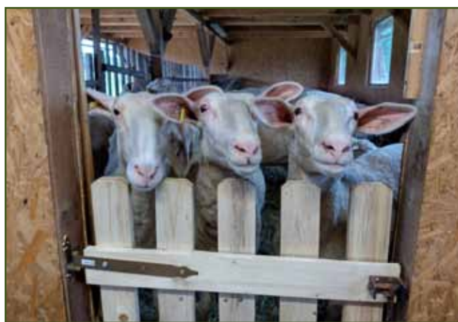
Čekání na dojení