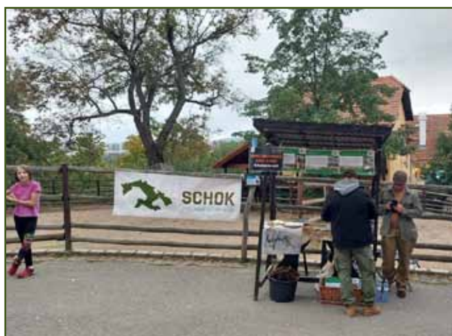
Svazový stánek v plzeňské zoo

Text a foto: Marie Králíková Foto: Radek Říha