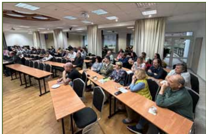
Pohled do přednáškového sálu