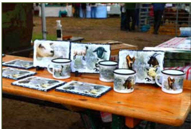
Ceny pro vítěze