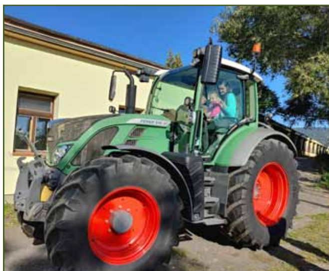
Projížďka v traktoru Fendt 516