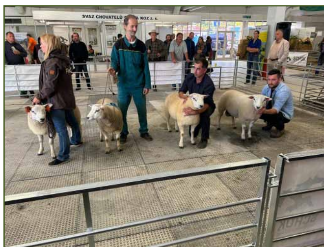
Čekání na vyhodnocení šampióna

Text a foto: Lukáš Neugebauer Foto: Pavel Trčka