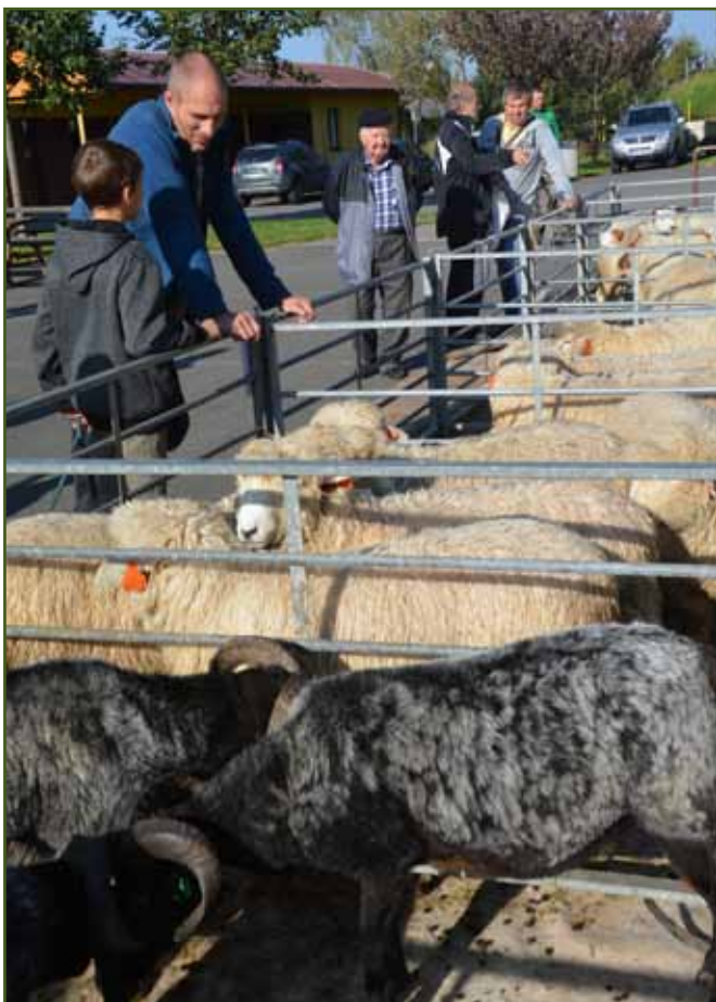
Kombinovaná plemena - ovce vřesové a romney