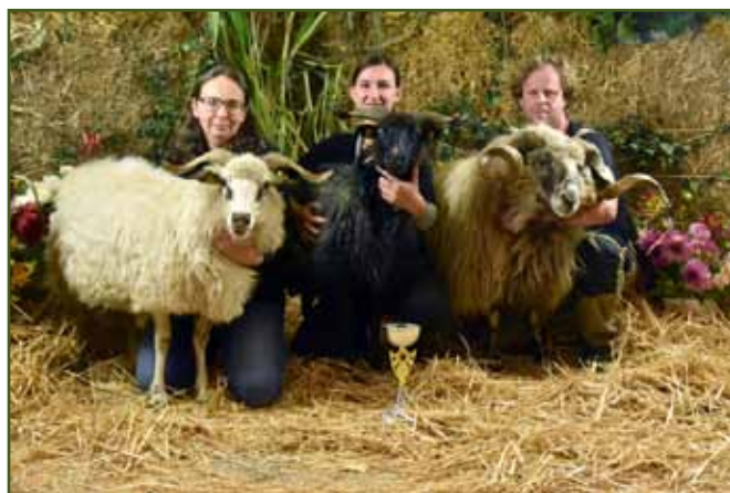
Druhá nejlepší kolekce ovcí na výstavě Náš chov 2023, valašské ovce ze Stránského z.s.