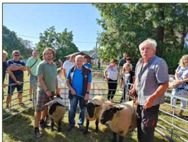
Výběr šampionů masných plemen