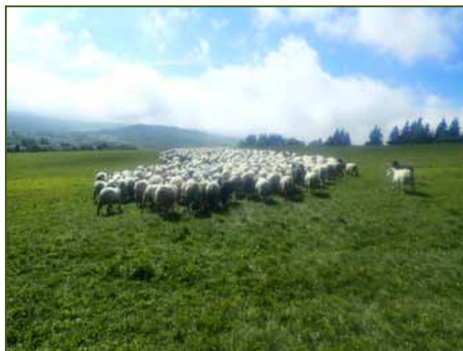
Srdce vytvořeno stádem ovcí pár okamžiků po napadení ovcí vlkem