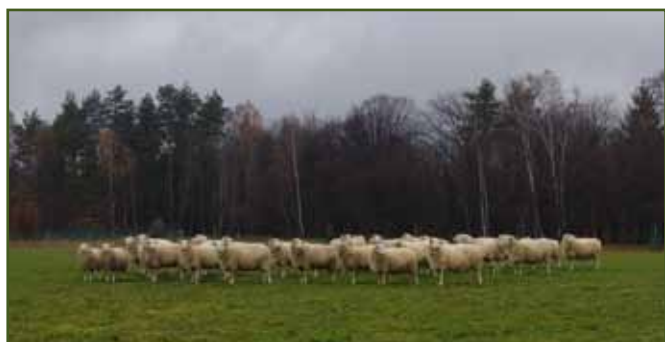
Holky jsou radost

Náš začátek hospodaření poznamenalo extrémní sucho, které vyšplhalo ceny balíků do neuvěřitelných výšin a začalo být jasné, že pozemek 3,5 ha, který jsme nechali osít pastevní směsí, nebude stačit na výrobu sena. První sena jsme dělali ručně a sekali každou větší zahradu v obci a okolí k radosti majitelů pozemků. Padali jsme na ústa a došlo nám, že se takto nejen sedřeme, ale nikam se neposuneme. Nájem pozemků a pořízení techniky začalo být nutností. Každý rok se nám podařilo propachtovat novou loučku, až jsme se dostali na současných 25 ha, které jsou pro naši menší techniku hraniční.