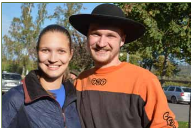
Mladá generace Říhů