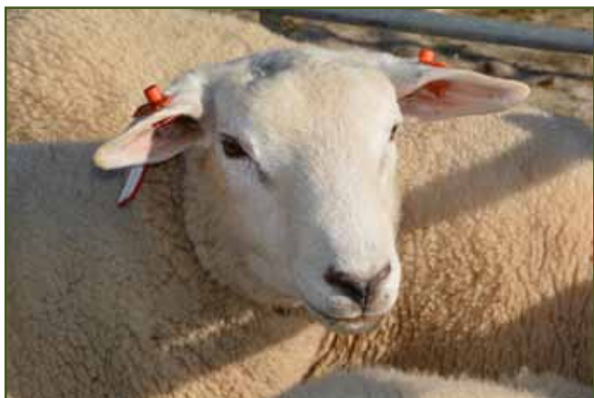
Texel Jiřího Gryžboně

Šampionem trhu se stal krásný beránek plemene texel z úpatí Radhoště chovatele Jirky Gryžboně z Frenštátu. Moc blahopřejeme!!!