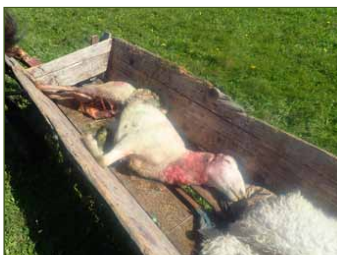
Slunečný den, téměř poledne a napadení stáda dvěma vlky, jehož výsledkem je zardousená ovce