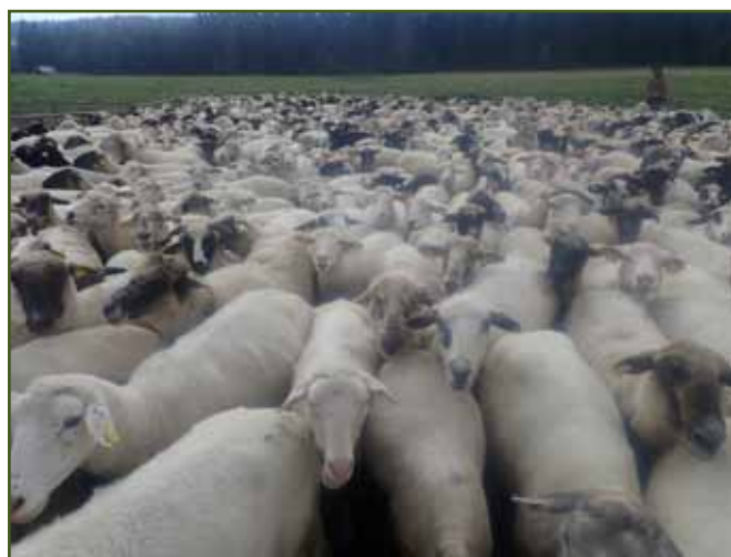
Ovce v honelnici na začátku dojení