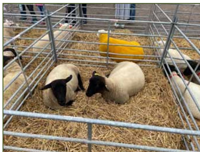
Suffolk Marcely Pulkrtové