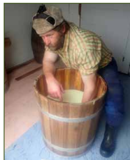
Bača Harman sbírá syr