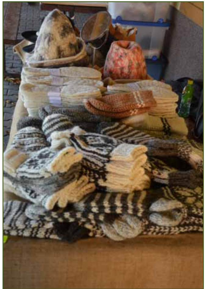
Vlněná výbava od Teichmannů