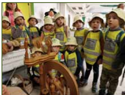
Setkání nejmenších s tradiční technikou spřádání vlny