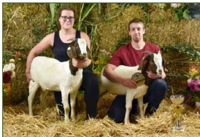
Nejlepší kolekce koz na výstavě Náš chov 2023, burské kozy společnosti Awaki s.r.o.