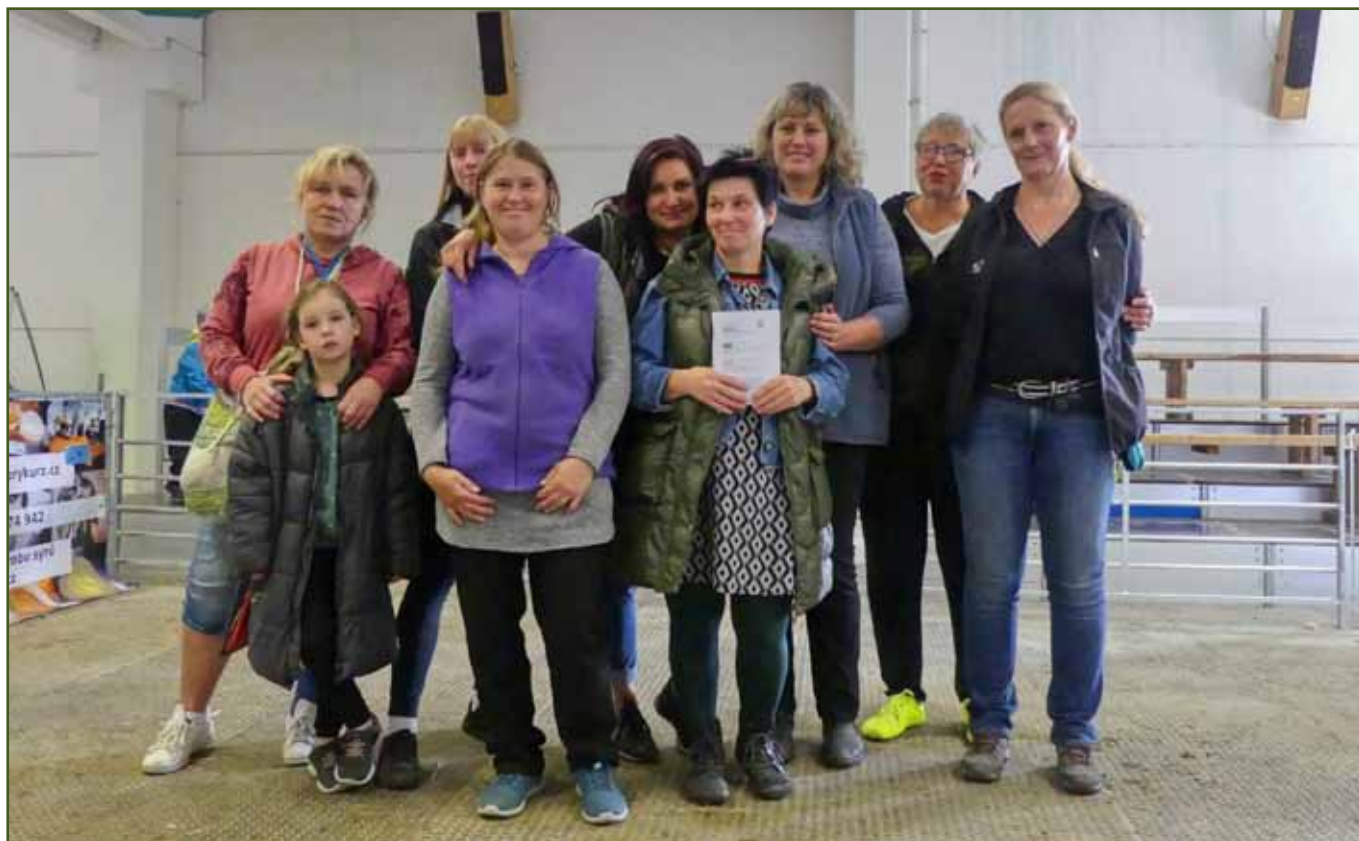
Účastníci Národního šampionátu AN koz 2023