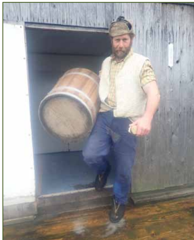
Taková fajná momentka ukazující nejen duchovní sílu bači, putěra cosi váží a bača ju nese jak nic