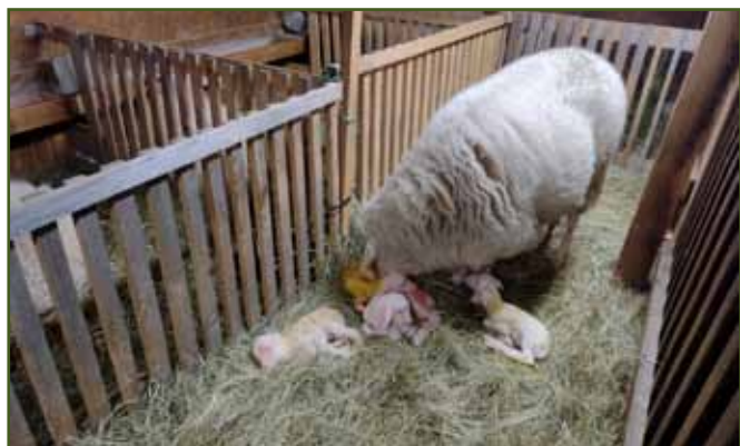
Čtyřčata nejsou raritou

Romantiku dojení při východu a západu slunce pod širákem vystřídala dojírna v nově postaveném ovčíně a vše začalo nabírat obrátky. Legalizace sýrárny, stavba samoobslužného krámků s lednicí, kde je v nabídce čerstvý sýr, tvaroh, kefir a jogurt. S česačkou vlny a kolovrátkem se popasovala naše osmdesátiletá babča, v krámků tak nechybí ani ponožky. V průběhu jara a léta se u nás zastavují turisté, projdou se po farmě, pohladí si ovečky, jehňata. Dochází k nám i děti z místní mateřské školky a okolních vesnic. Obec Janov přijala naši farmu se vším všudy, dokonce i s obdobím odstavů, kdy je u nás poněkud hlučno.