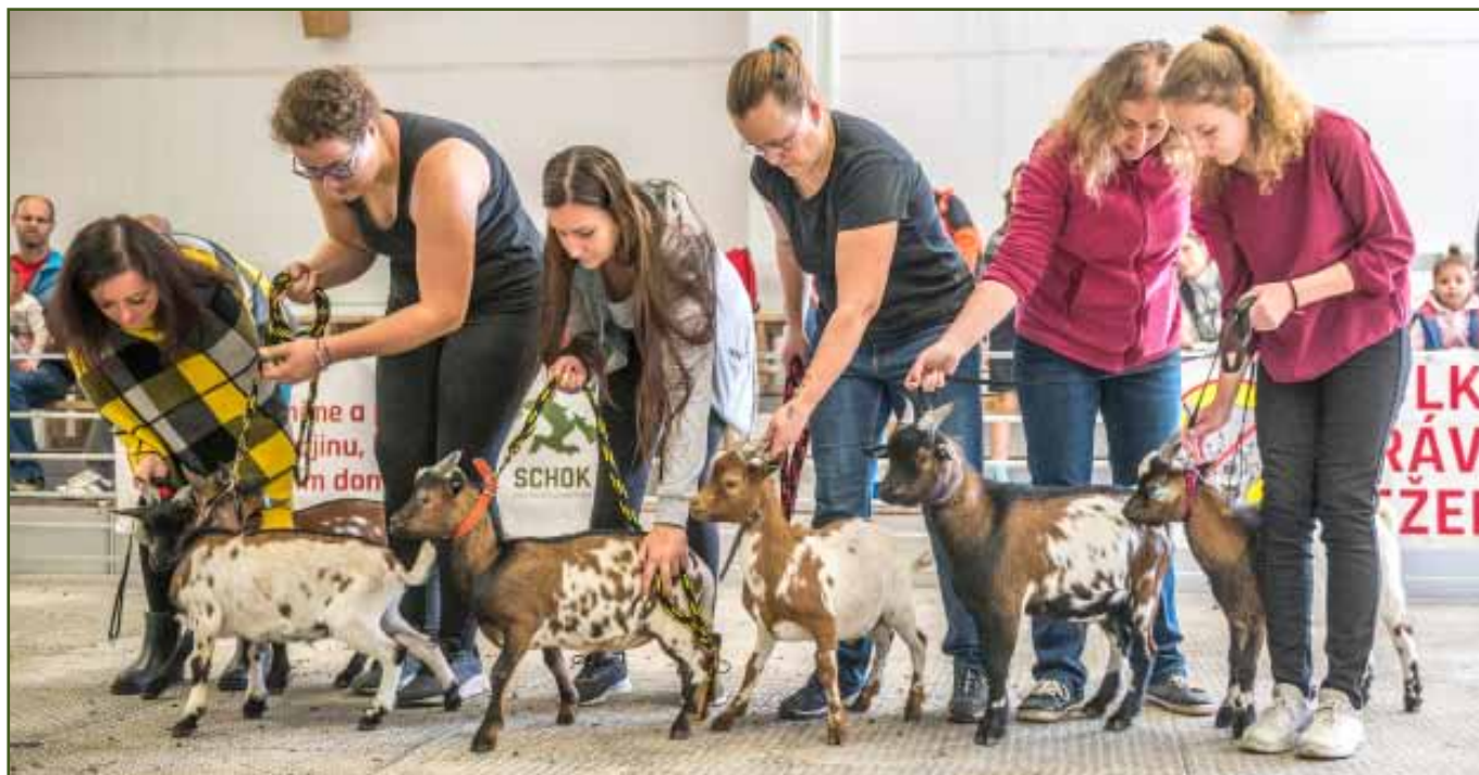
Národní šampionát zakrslých koz, výběr šampionů koz

Všichni berani vynikali pěkným osvalením, pohlavním výrazem a dobře utvářenými končetinami.