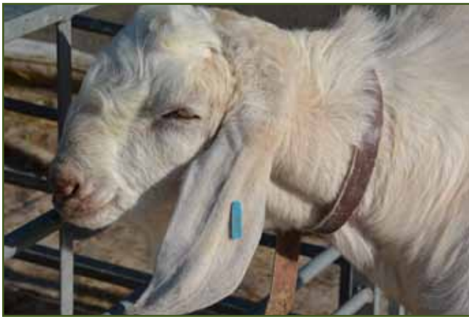
Anglonubijský kozel Kateřiny Mimochodkové