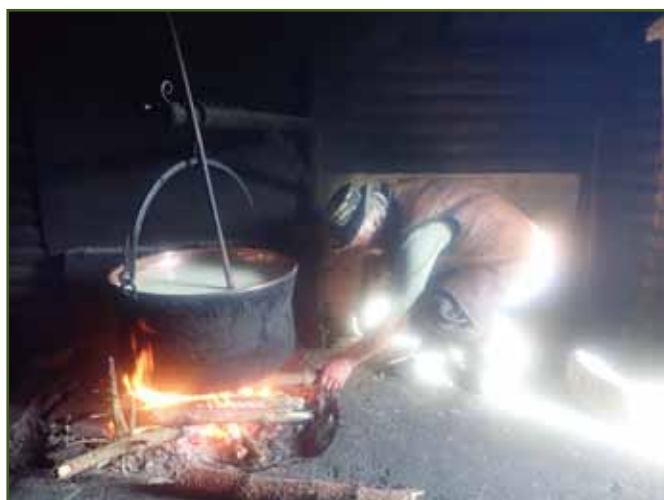
Odvárání žinčice v měděném kotlu na živém ohni je neopakovatelným zážitkem