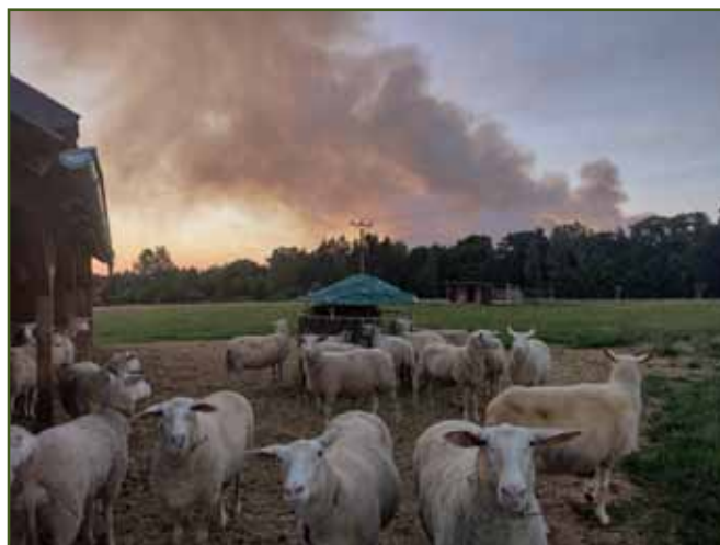
Požár v Národním parku