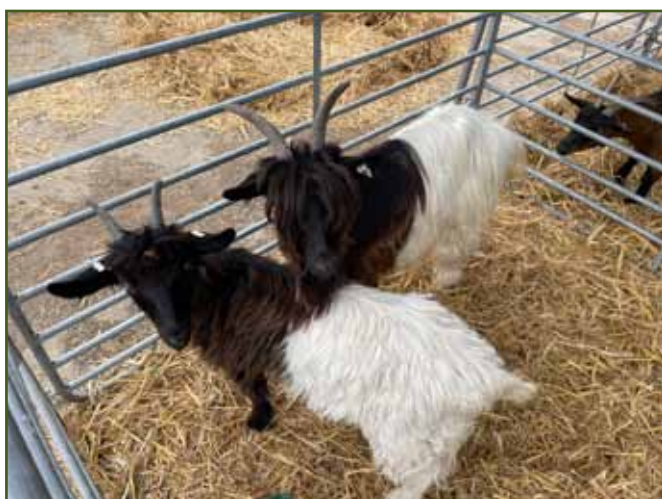
Kozy walliserské černokrké