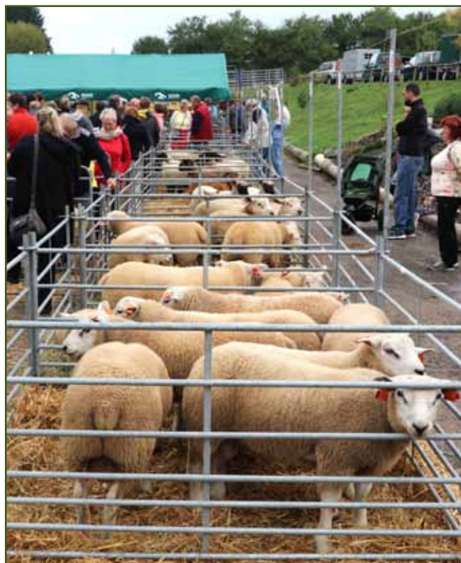
Pohled na vystavené kolekce ovcí