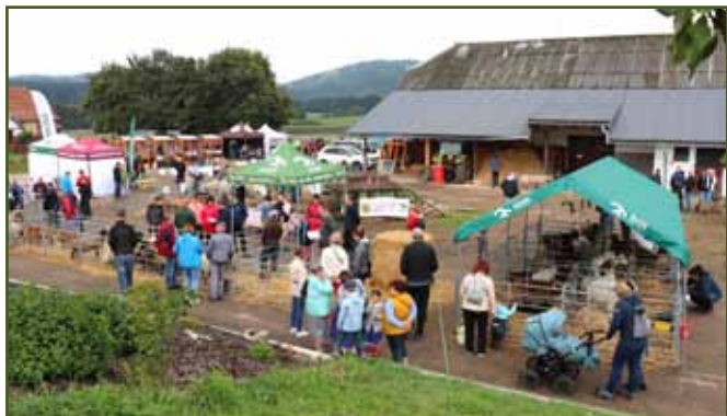
Pohled na místo konání akce v areálu firmy Dibaq

Vážení čtenáři a chovatelé, v letošním roce dne 23. září se nám podařilo uskutečnit krajskou výstavu ovcí a koz, která se dříve konala na Pardubickém hipodromu při události Koně v akci. Pokusili jsme se tedy tuto akci obnovit, a to na základě toho, že v loňském roce proběhl nákupní trh beranů a kozlů v chovatelském centru Fitmin firmy Dibaq a. s. v Helvíkovicích, který jsem tam zorganizoval. Na tento trh byl nejen z mého hlediska velmi kladný ohlas, jak od chovatelů, tak i od firmy, na které akce probíhala a umožnila ji tam i uskutečnit. Rozhodl jsem se tedy do toho ještě více vložit a společně se všemi, kdo tuto akci připravovali a spoluorganizovali, připravit větší chovatelskou událost, a to již zmiňovanou Krajskou výstavu ovcí a koz. Vše dopadlo na výbornou, protože ohlasy byly velmi kladné!